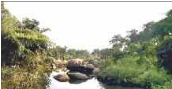
दोंदरो नाला जहां बनेगा एनीकट।

आसपास के ग्रामों के खेतों की सिंचाई के लिए पानी की सुविधा उपलब्ध कराने के उद्देश्य से निर्माण कराया जा रहा है, किंतु ग्रामीणों के स्थान बदलने की मांग पर अड़ होने के कारण सिंचाई विभाग के अमले को दो बार बैरंग लौटना पड़ा है। सिंचाई के रकबे को बढ़ाने के